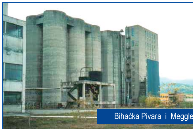
Bihaćka Pivara i Meggle, pozitivni primjeri privatizacije

Ima li država odnos prema Unsko-Sanskom kantonu kakav