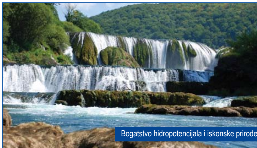
Bogatstvo hidropotencijala i iskonske prirode

Koje su osobenosti Unsko-Sanskog kantona, u odnosu na druge bh. sredine ?