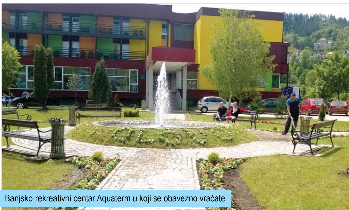
Banjsko-rekreativni centar Aquaterm u koji se obavezno vraćate

Proširenje smještajnih kapaciteta realizovano je 1982. godine, izgradnjom dodatne 22 sobe i prostorom za terapijske procedure, a kao Javna zdravstvena ustanova Aquaterm registovan je 2000. godine, čija je osnovna djelatnost fizikalna medicina i rehabilitacija.