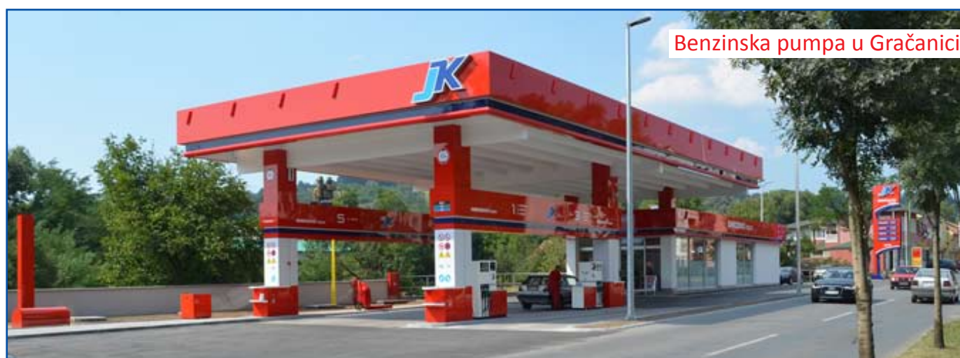
Benzinska pumpa u Gračanici

proizvoda odgovarati na zahtjeve tržišta, kupcima pružiti više od njihovih očekivanja, zaposlenima