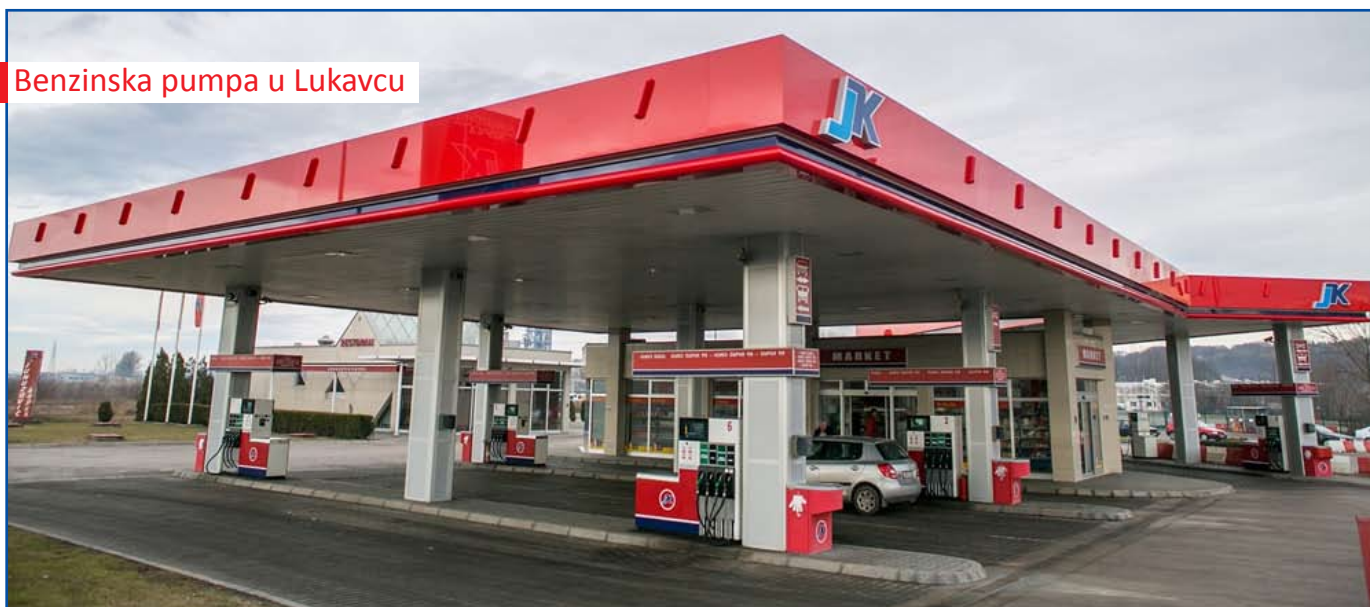
Benzinska pumpa u Lukavcu

Svi autobusi opremljeni su i sigurnosnim kamerama čime se povećava sigurnost putnika. Time je Tuzlacima na raspolaganju prevoznik po uzoru na evropske metropole, a njihova vožnja je sigurnija i udobnija. Pored vlastitih potreba za CNG plinom, 24. oktobra ove godine JUNUZOVIĆ KOPEX postao je vlasnik i CNG terminala u Sarajevu. Ovo CNG postrojenje predstavlja i veleprodajni distributivni centar CNG-a, što dokazuje težnju i ozbiljne poslovne namjere kada je u pitanju