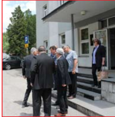
Posjeta Dragana Čovića općini Vareš

spremnost za pomoć, uvjerali se u potencijale kojima raspoložemo i htijenjem kako bi Vareš ponovo dobio mjesto koje je imao i koje nadasve zaslužuje.