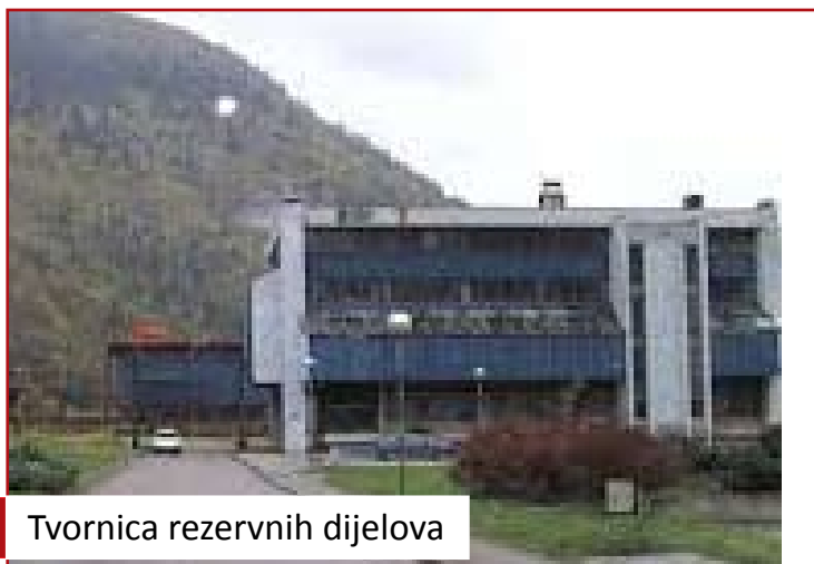
Tvornica rezervnih dijelova

Mogu da najavim sasvim izvjesno instalisanje opreme punionice vode, te proizvodnju ekološke hrane, sa akcentom na vrhunski kvalitetan kravlj