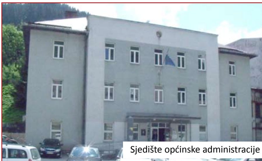
Sjedište općinske administracije

Kvalitet kamena iz Vareša potvrđen je u izgradnji autoputeva u Hrvatskoj i Crnoj Gori, a uvjeren sam da će i kompanije koje grade bosanskohercegovački autoput prepoznati prednosti ovog materijala, početi ga koristiti i time riješiti trenutne poslovne poteškoće sa kojima je suočen Rudnik kamena.