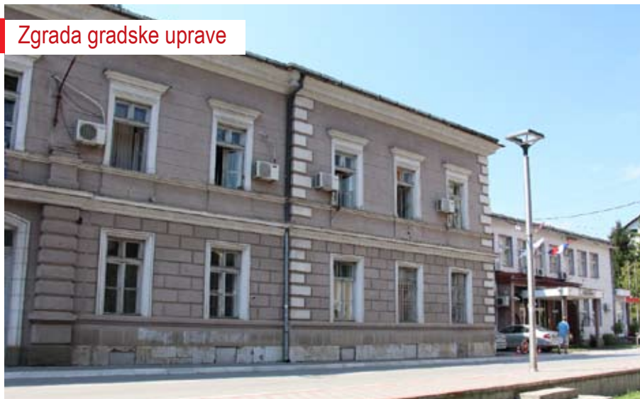
Zgrada gradske uprave

BH BUSINESS MAGAZINE: Gospodine Stevanović, šta su bile osnovne odlike privrednog ambijenta općine Zvornik u ex jugoslovenskim okvirima?