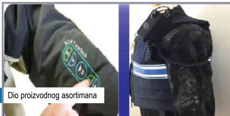
Dio proizvodnog asortimana

odnosno infrastrukturni kapaciteti kojima raspoložemo respektabilni, a akcenat moramo posvetiti tehničko-tehnološkom osavremenjavanju.