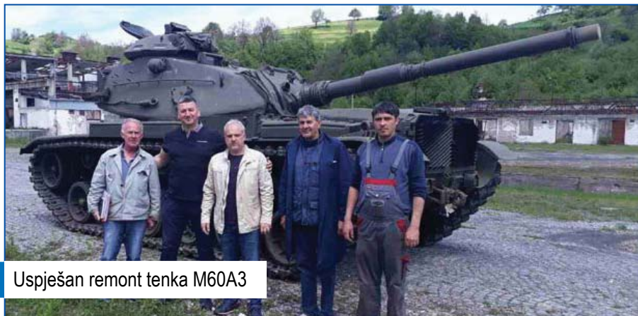
Uspješan remont tenka M60A3

iziskivale su određivanje jasnih planskih aktivnosti, čijom dosljednom realizacijom rezultati nisu izostali.