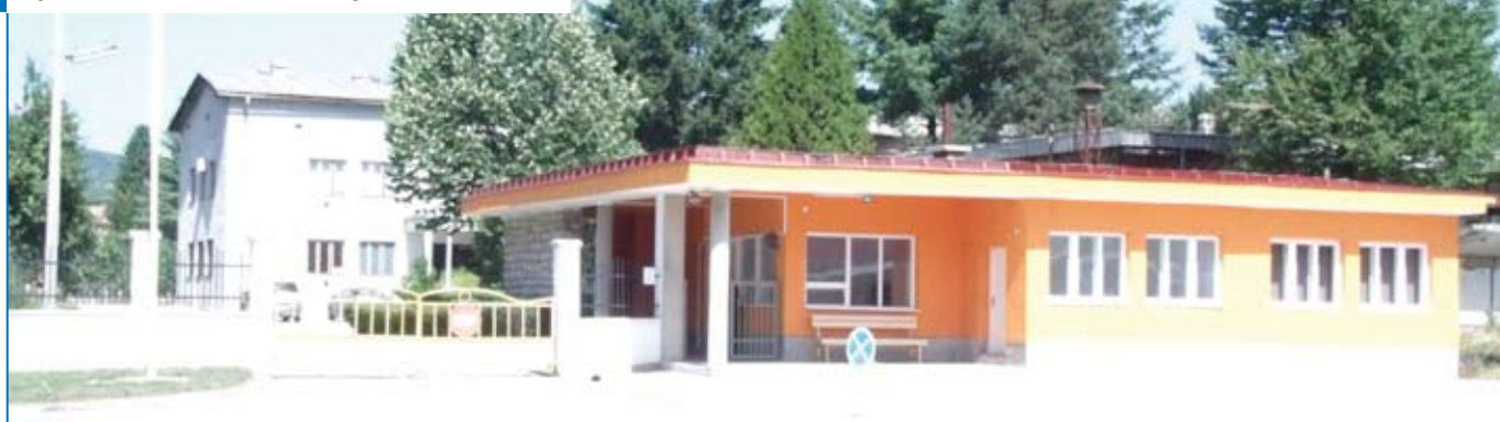
Sjedište Tehničko-reмонтnog zavoda Hadžići