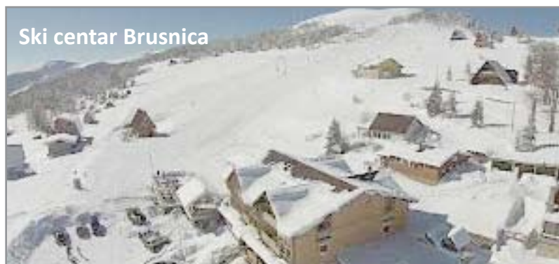
Ski centar Brusnica