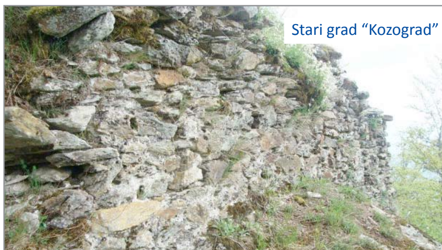
Stari grad "Kozograd"

njene prirodne ljepote, a to je već pomenuto Prokoško jezero, slapovi Kozice, planinski masiv vranice, Jezernica, Pogorelica, Brusnica i veliki broj mjesta za odmor i rekreaciju.