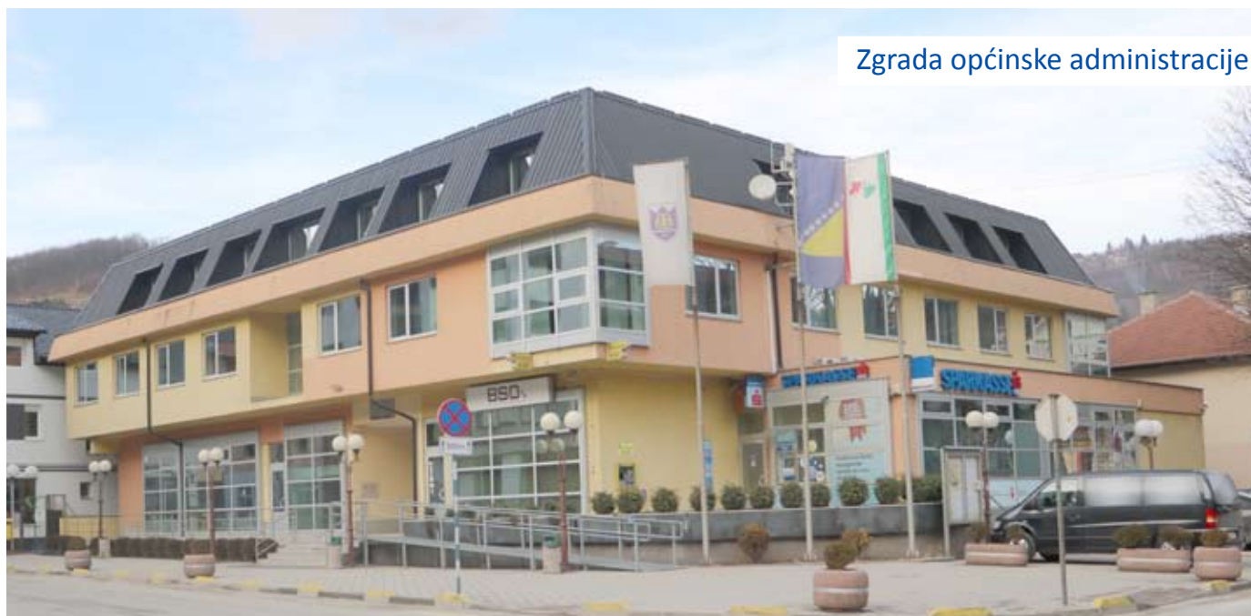
Zgrada općinske administracije

otvoreni Zelena pijaca i autobuska stanica, koji su godinama bili prioritetni.