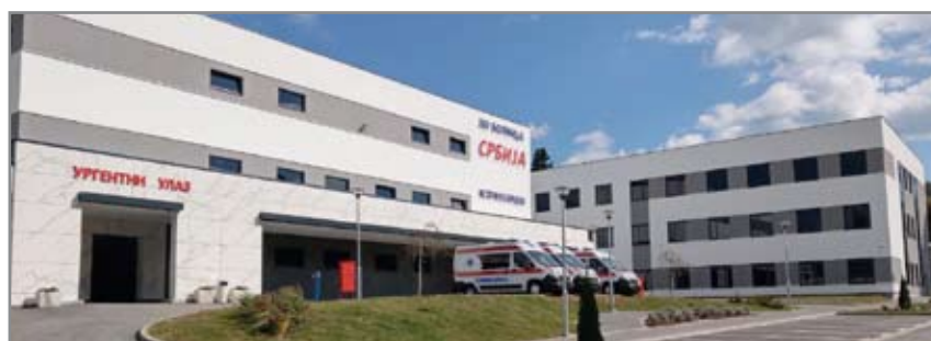
Otvaranje novoizgrađene bolnice "Srbija" u Istočnom Sarajevu

akademiji, zaslužuju poštovanje ponos su našega grada. S tim u vezi želim da istaknem trenutno najvažniji događaj, a to je gradnja pozorišta u Istočnom Sarajevu, koje treba da zaokruži naša dugogodišnja htijenja po pitanju infrastrukture u oblasti kulture. Ovo područje zaslužuje taj objekat, čime će se stvoriti puno bolji uslovi za razvoj društvenih aktivnosti građana.