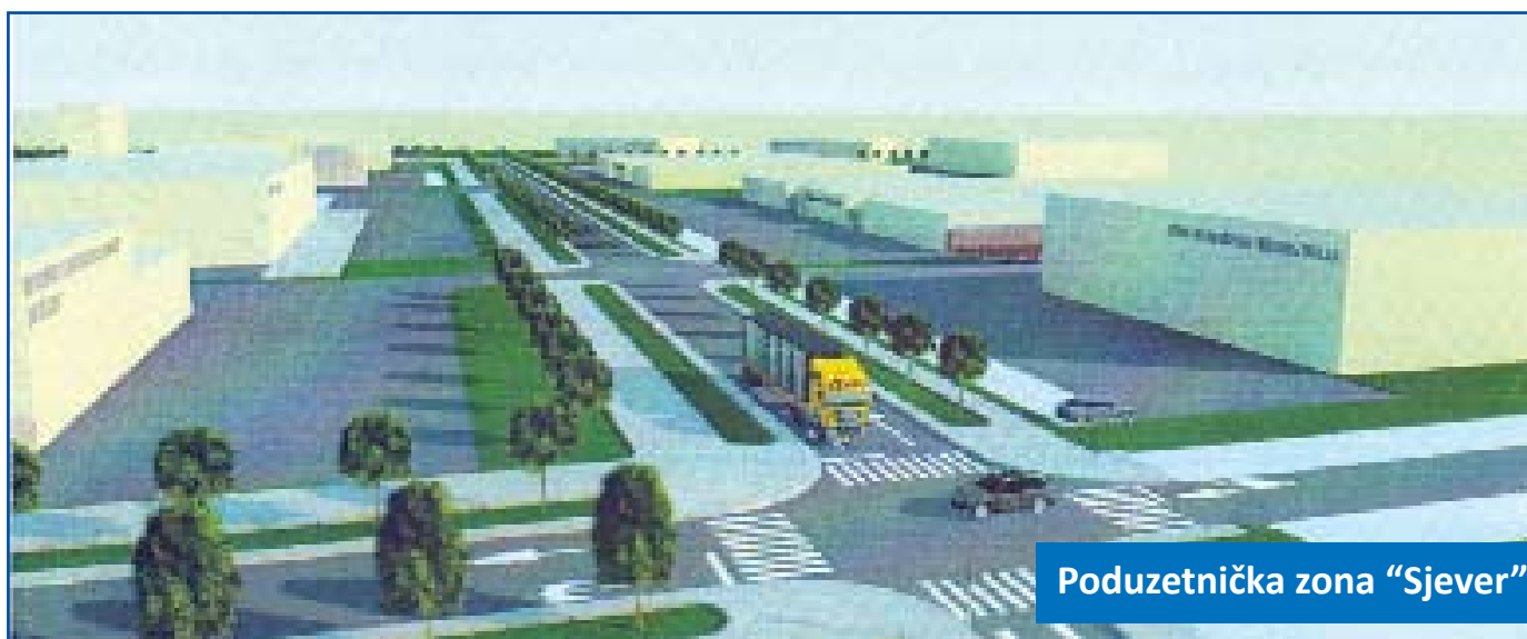
Poduzetnička zona "Sjever"

Takav trend je nastavljen i u poslijeratnom periodu, a posebno u posljednjih nekoliko godina.