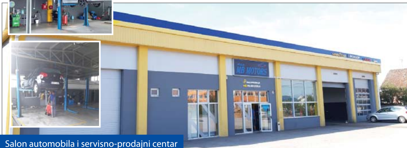
Salon automobila i servisno-prodajni centar