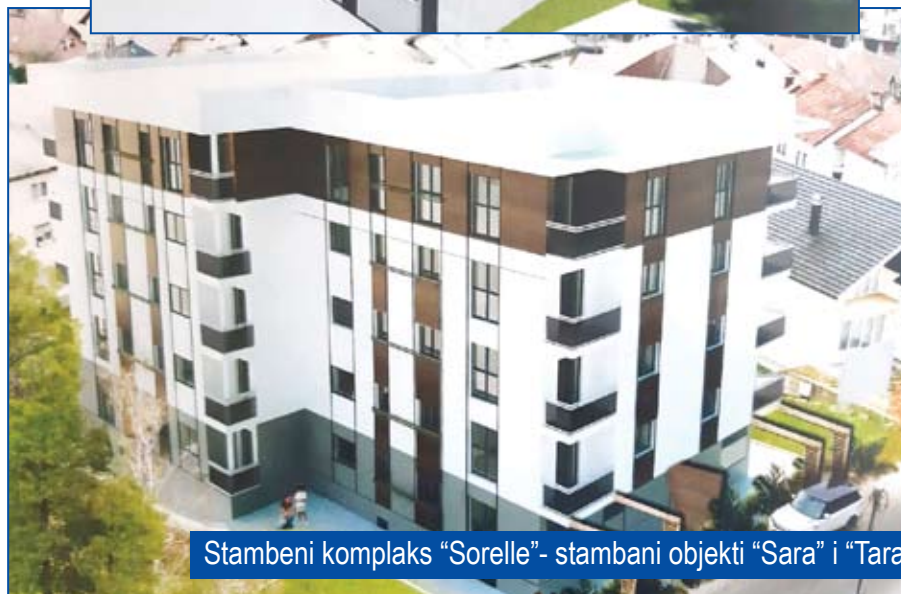
Stambeni kompleks "Sorelle" - stambani objekti "Sara" i "Tara"