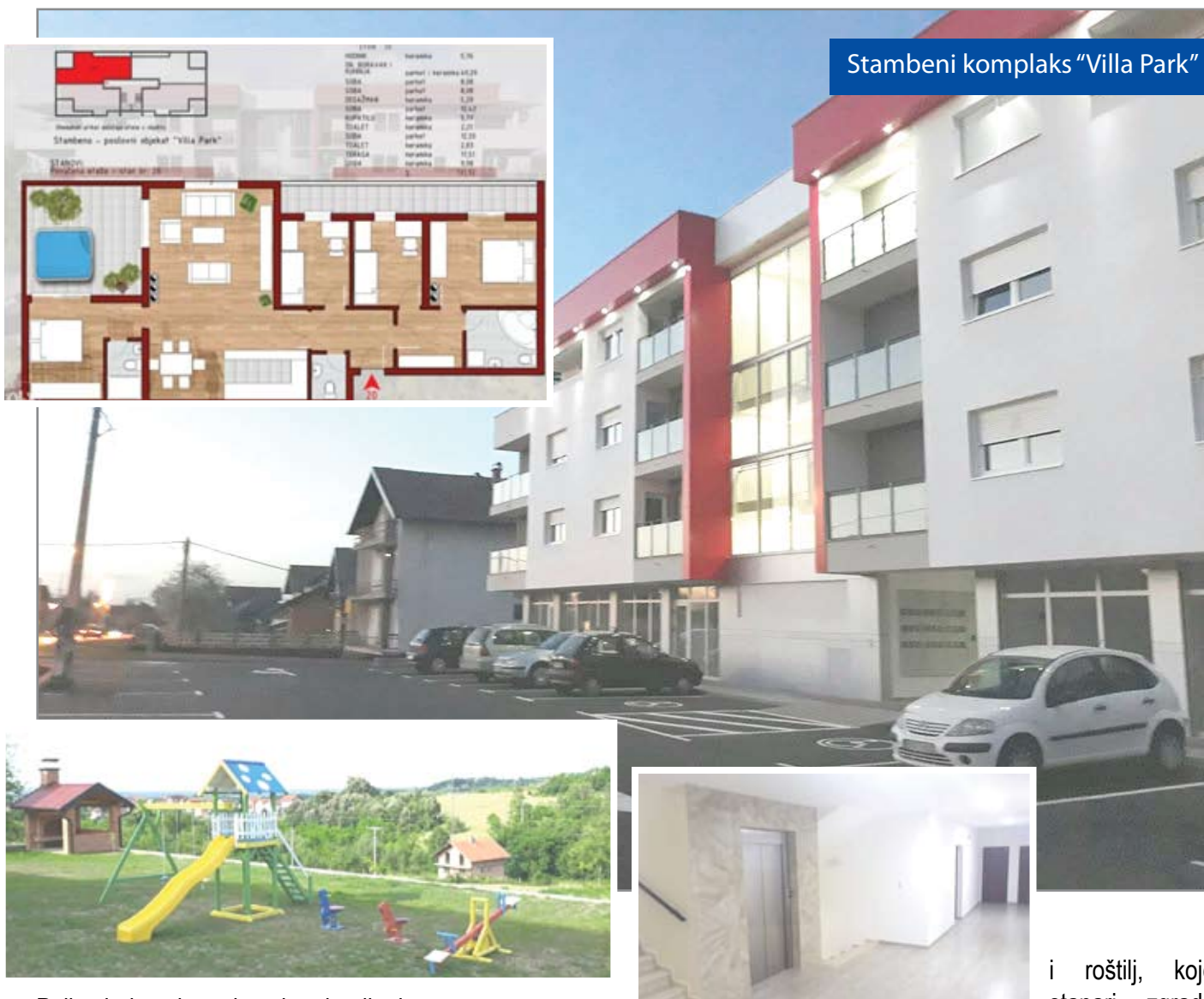
Stambeni kompleks "Villa Park"

Polje jedan je od najmodernih i opremljenih auto servisa u Posavini, u kome je moguće uraditi brzi servis vozila, dijagnostiku, servis klime i optiku trapa, te po pristupačnim cijenama nabaviti skoro sve poznate svjetske i domaće brendove guma i auto felgi.