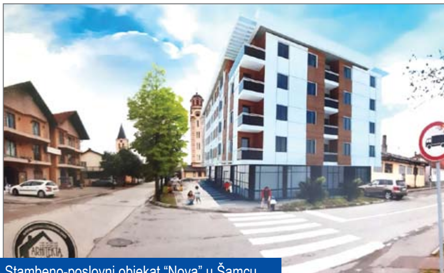
Stambeno-poslovni objekat "Nova" u Šamcu