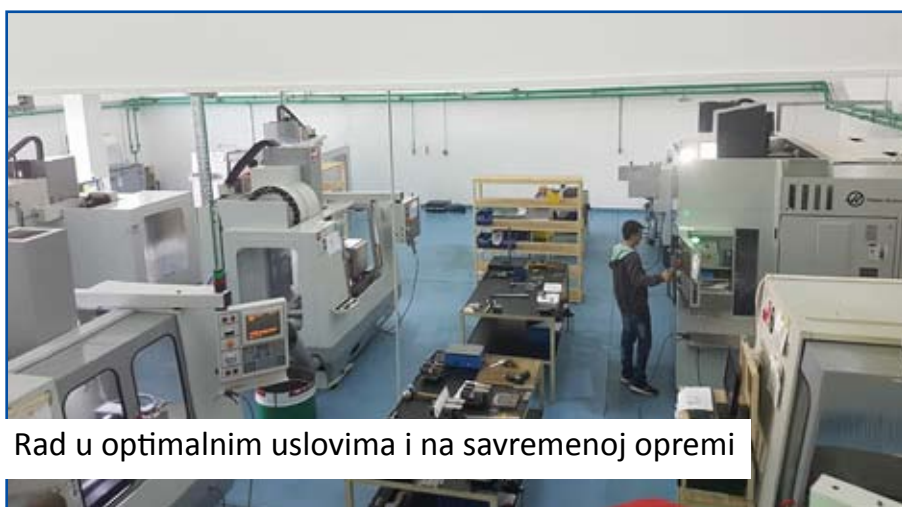
Rad u optimalnim uslovima i na savremenoj opremi