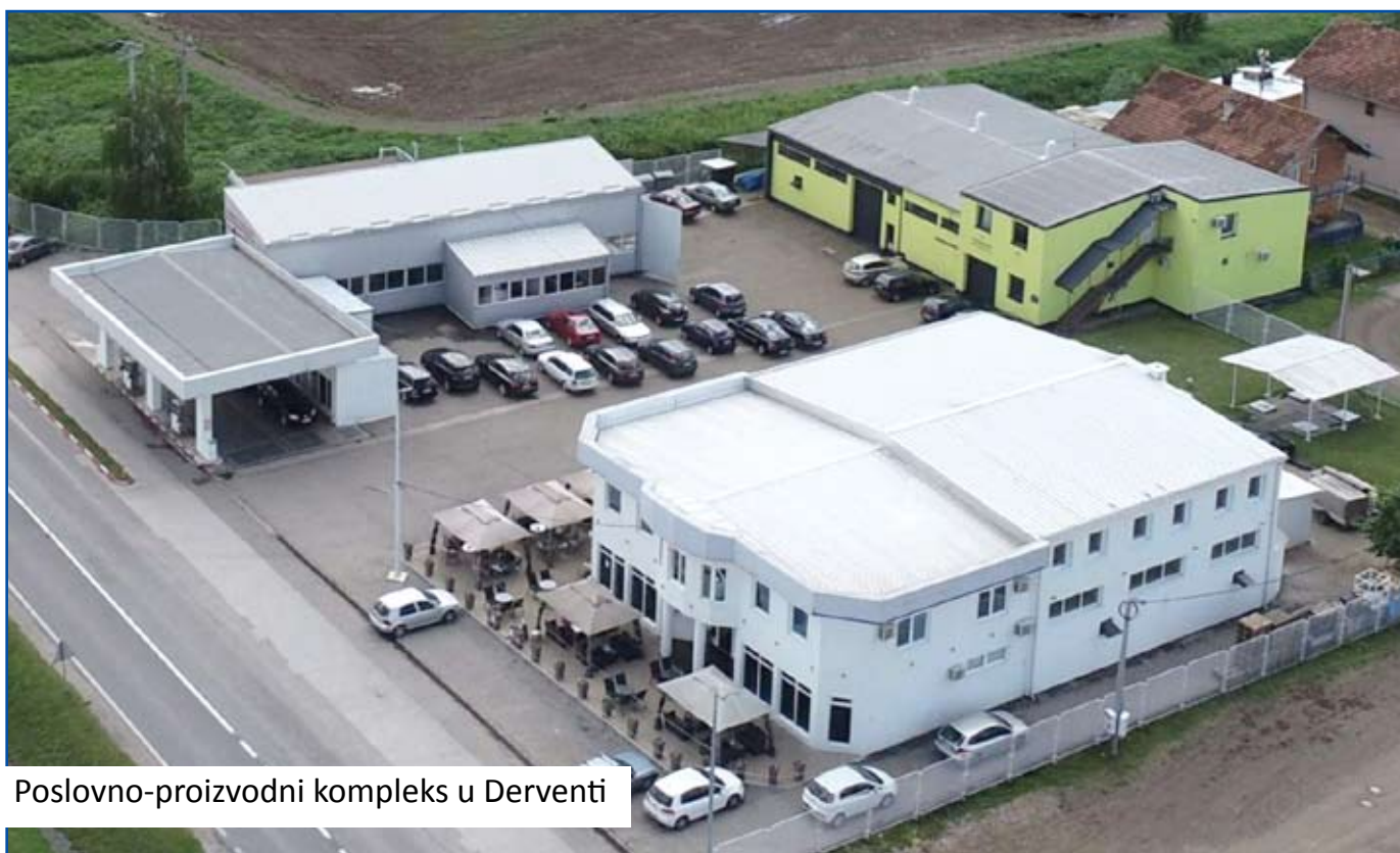
Poslovno-proizvodni kompleks u Derventi