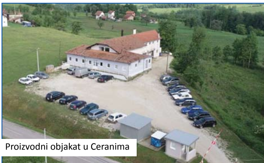
Proizvodni objekat u Ceranima

Naša specifičnost je da vršimo proizvodnju pojedinačnih dijelova, odnosno unikata, čija je odlika velika preciznost izrade, koje radimo direktno za BMW, a indirektno za Daimler Benz, Audi, Wokswagen, Volvo, Jaguar, Porsche, te neke kineske i američke firme, čime se naši proizvodi isporučuju, ugrađuju