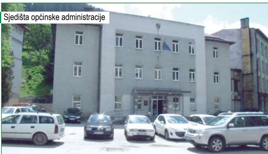
Sjedišta općinske administracije

Šansu razvoja vidim u izgradnji poslovnih zona koje treba ponuditi tržištu, što bi bio zamajac razvoja Vareša i šireg okruženja.