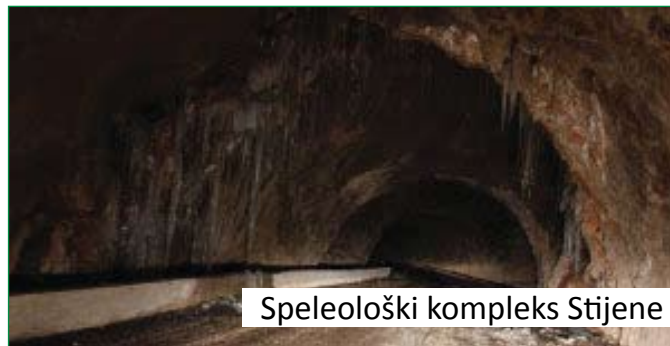
Speleološki kompleks Stijene

znatnoj mjeri je zaustavila predviđene aktivnosti, ali sam uvjeren da ćemo ovu situaciju prevazići i veoma brzo vratiti