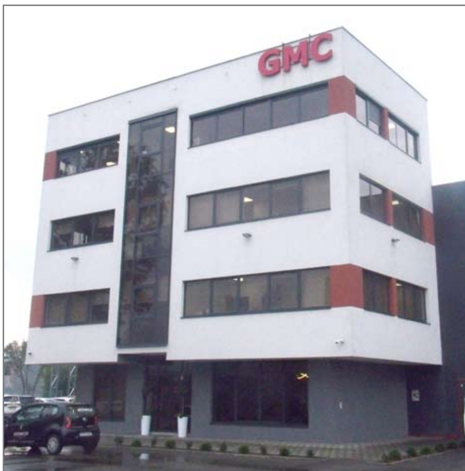
Poslovni objekat u općini Usora

POSLOVNOST I KVALITET POTVRĐENI NA SVJETSKOM TRŽIŠTU