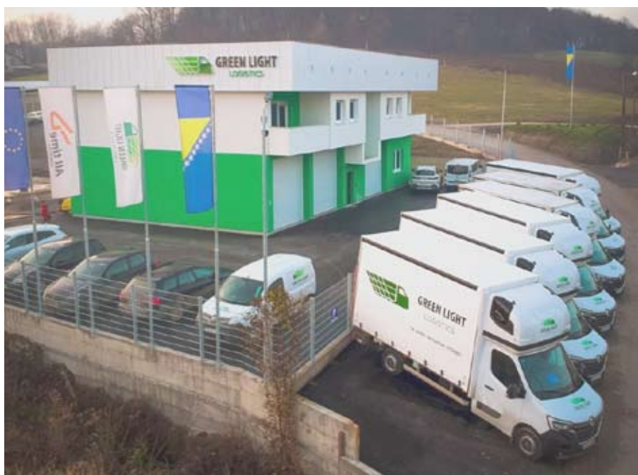
Najmoderne bh. sjedište uprave u oblasti transporta