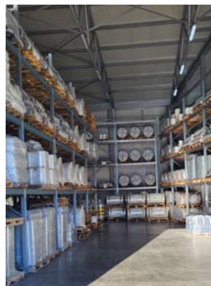
Skladište gotovih proizvoda

smo mnogo u infrastrukturu i dijelom u opremu.