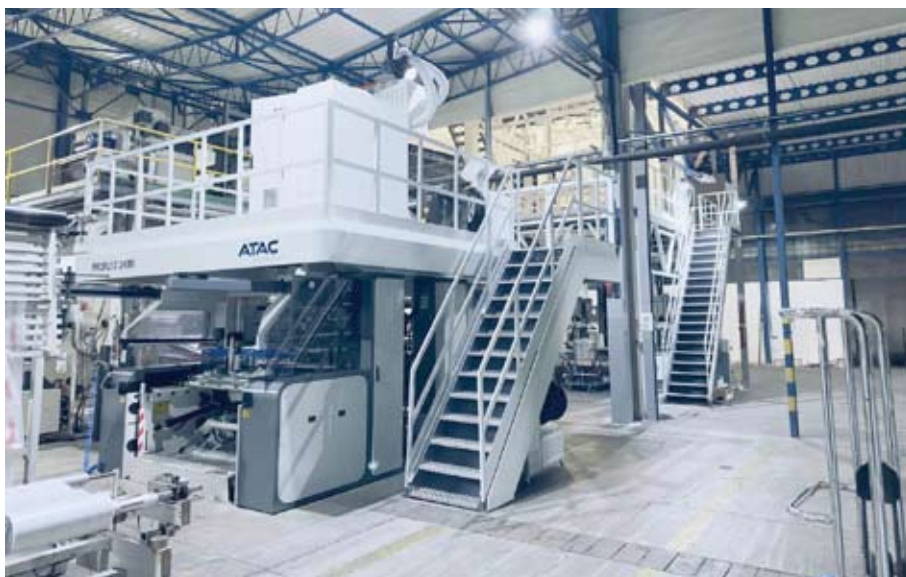
Detalji iz proizvodnje