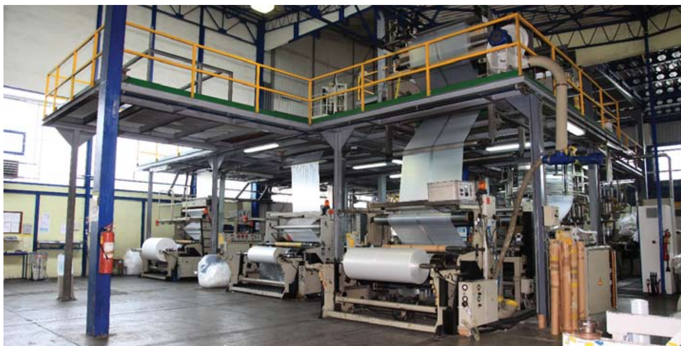
Savremena proizvodna tehnologija

Naš asortiman smo podijelili u sedam grupa sa kojima možemo