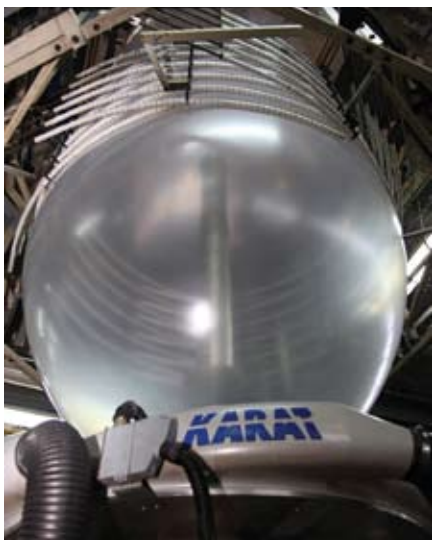
Detalji iz proizvodnje

SEAD VAJZOVIĆ: Trenutni omjer plasmana na domaćem i ino tržištu je 70:30. Sa investicijama koje smo uradili u prethodnoj i onim koje planiramo uraditi u narednoj godini, planiramo da odnose izjednačimo.