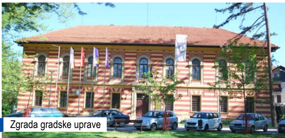
Zgrada gradske uprave