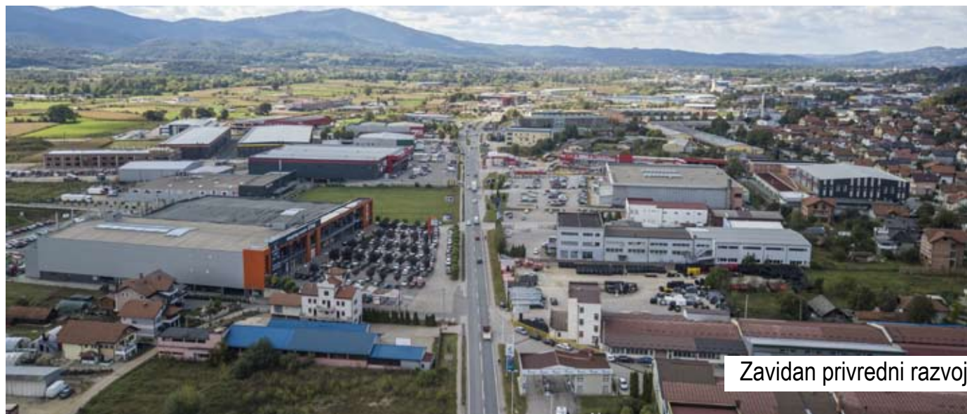
Zavidan privredni razvoj