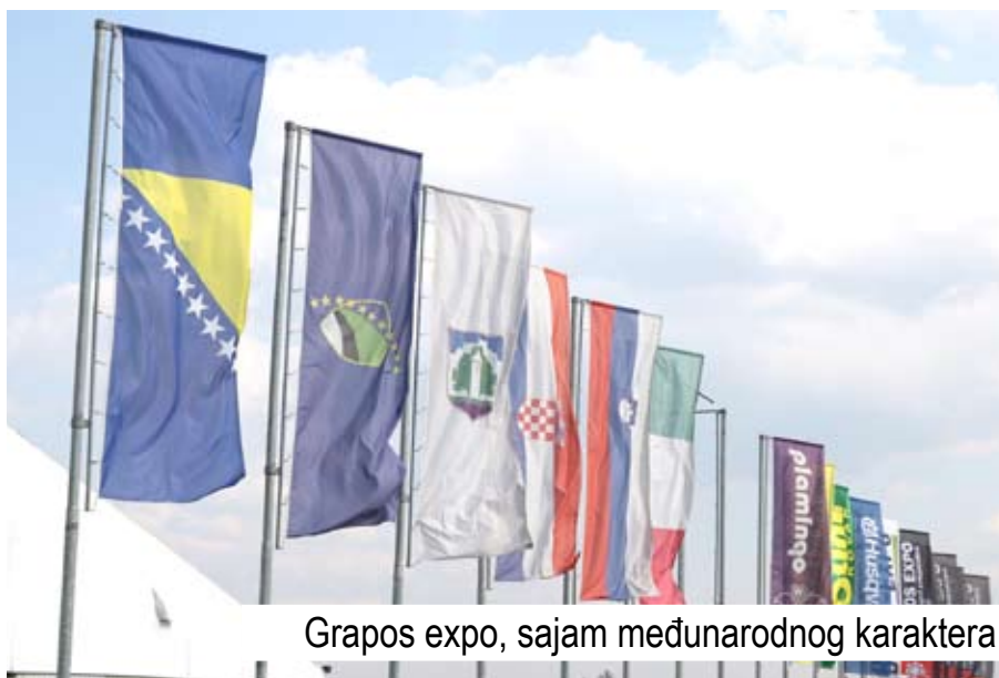
Grapos expo, sajam međunarodnog karaktera

Koje aktivnosti predstavnici Grada realizuju po pitanju saradnje sa privrednicima?