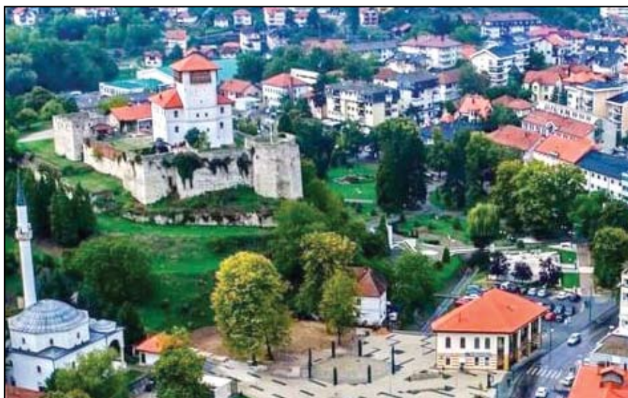
Gradačac, sajamski grad