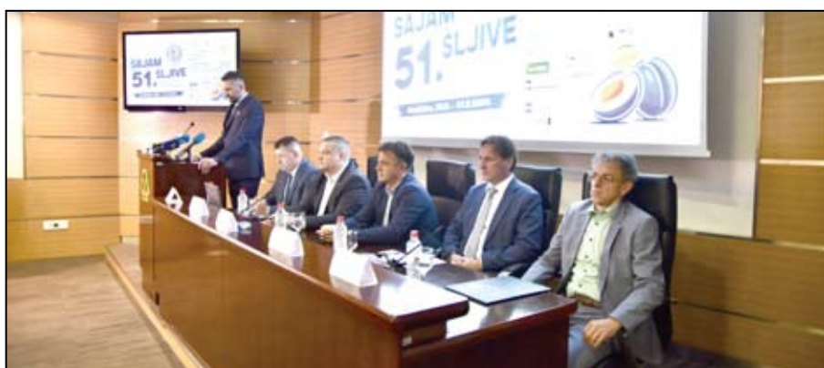
Podrška bh. zvaničnika