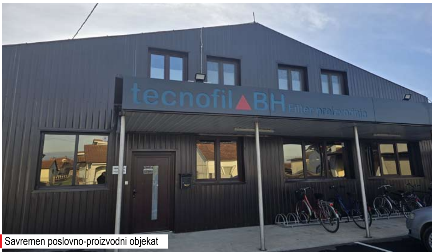
Savremen poslovno-proizvodni objekat

To podrazumijeva postrojenja, opremu i alate, čija je vrijednost oko sedam miliona KM.