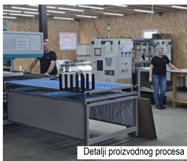
Detalji proizvodnog procesa