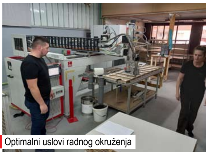
Optimalni uslovi radnog okruženja

Gospodine Devedžić, šta predstavlja strateške planske