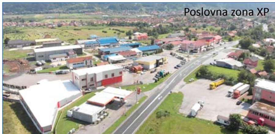
Poslovna zona XP

Ponavljam, prva općinska poslovna zona koja je u Žepču izgrađena bila je zona XP, zatim je to bila poslovna zona Begov Han, treća