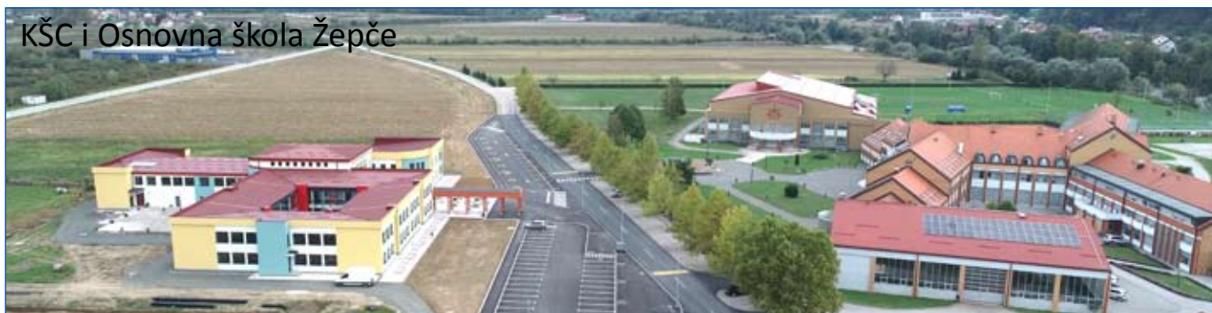
KŠC i Osnovna škola Žepče

vrijeme sa sobom nosilo i problema sa kojima smo bili suočeni u prvim poslijeratnim godinama, od 2009. godine smo jedina općina u Bosni i Hercegovini i regiji koja upravlja osnovim i srednjim obrazovanjem na način da utvrđujemo plan upisa, nastavni plan i program i finansiramo troškove uposlenih u prosvjeti. I još nešto veoma bitno, a to je ono što sam nazvao projektom 21. stoljeća, odnosi se na gradski kolektor sa prečištačem otpadnih voda koji