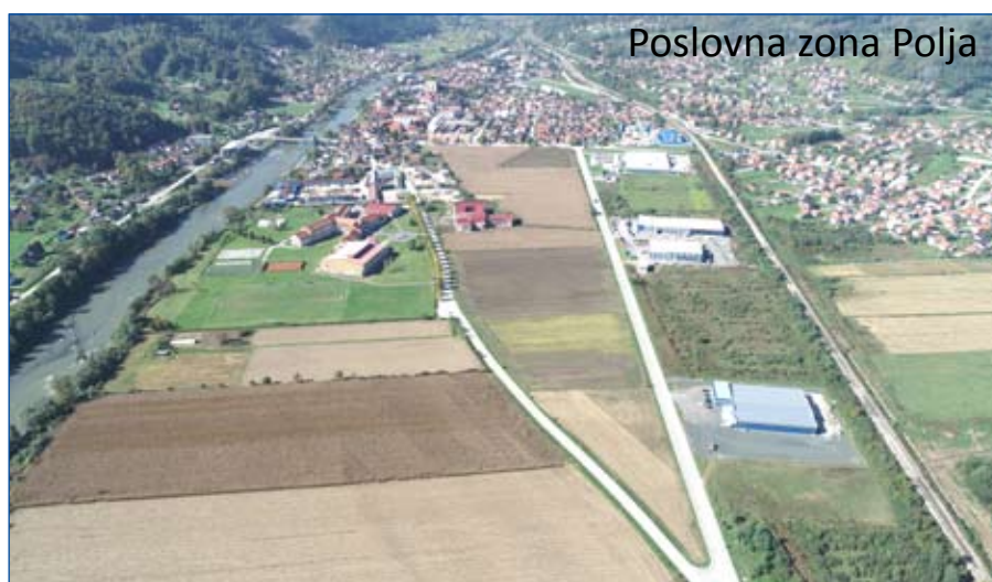
Poslovna zona Polja