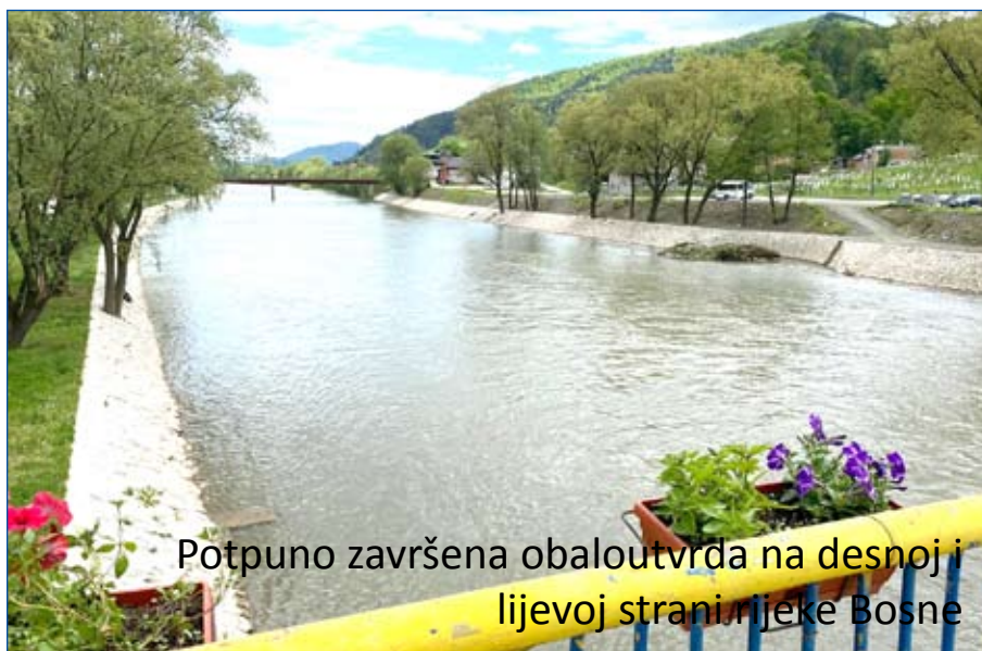
Potpuno završena obaloutvrda na desnoj i lijevoj strani rijeke Bosne

Razvojna agencija koju imamo funkcionira već četrnaest godina, čija je zadaća da implementira strategiju općinskog razvoja, da iznalazi projekte i da ih realiziramo i kroz to