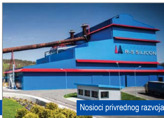
Nosioci privrednog razvoja