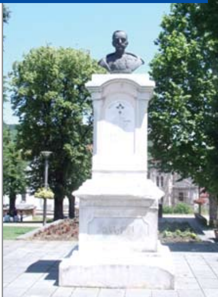
Spomenik Kralju Petru Prvom Karađorđeviću

ministarstava oko 1,3 miliona KM, te kroz partnerstvo privatnog i javnog sektora oko pet miliona.