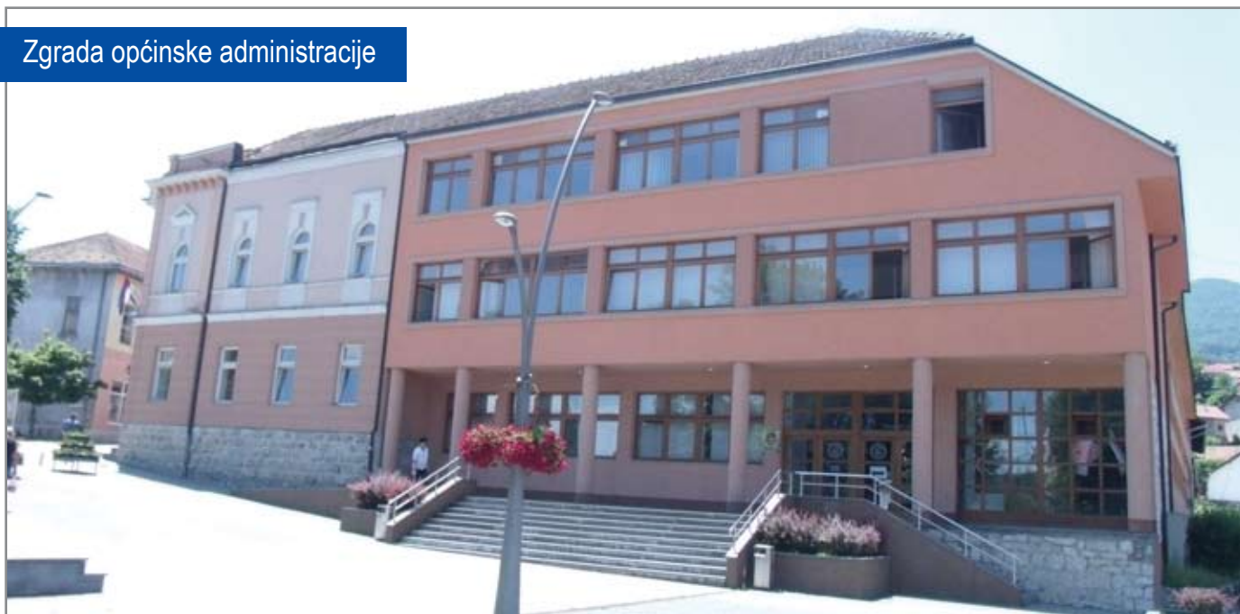
Zgrada općinske administracije

Ova fabrika je, zahvaljujući Investiciono-razvojnoj Banci RS, dokapitalizovana i obezbijeđena sredstva uložana su u infrastrukturu, odnosno uređenje enterijera, te nabavku mašina i opreme i danas su u fabrici, pod jednim krovom, tri preduzeća u oblasti tekstilne industrije.